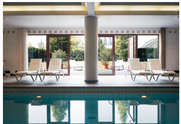
Schwimmbad mit Sonnenterrasse